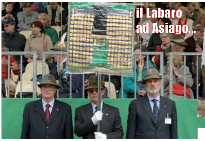
il Labaro ad Asiago...