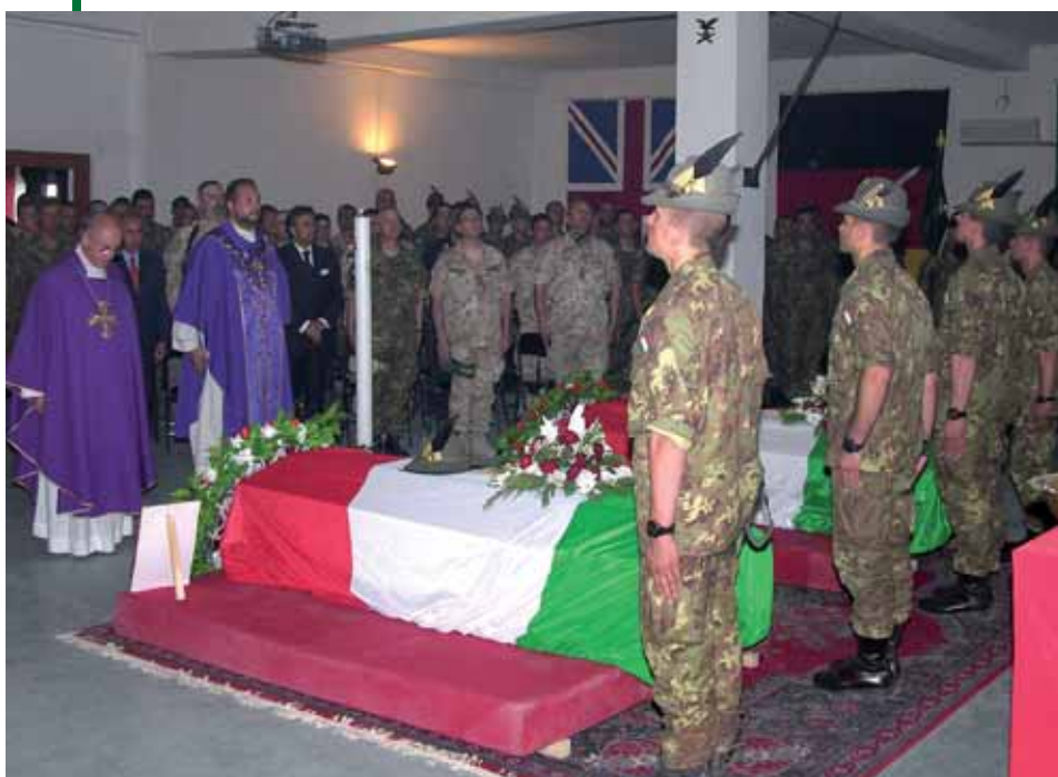
Lonore ai due Caduti prima della partenza dei feretri dalla base italiana a Kabul.

Sono tutti messaggi che esaltano la missione di pace dei nostri militari, il loro senso del dovere, che manifestano partecipazione al dolore delle famiglie. Non c'è, fra le tante improntate alla pietà per i Caduti e al profondo rispetto per il loro sacrificio, una sola parola che ispiri alla vendetta. ●