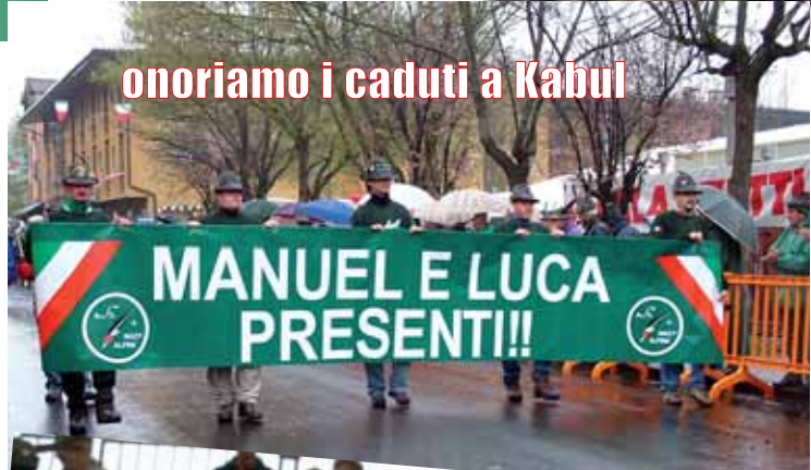
onoriamo i caduti a Kabul