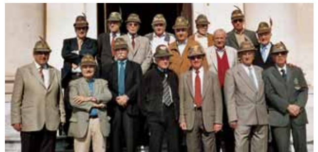
Un bel gruppo di ufficiali che hanno prestato servizio nel BAR Julia di Bassano nel 1960/61. L'incontro è avvenuto a Marostica, ospiti della nuova sede della sezione.