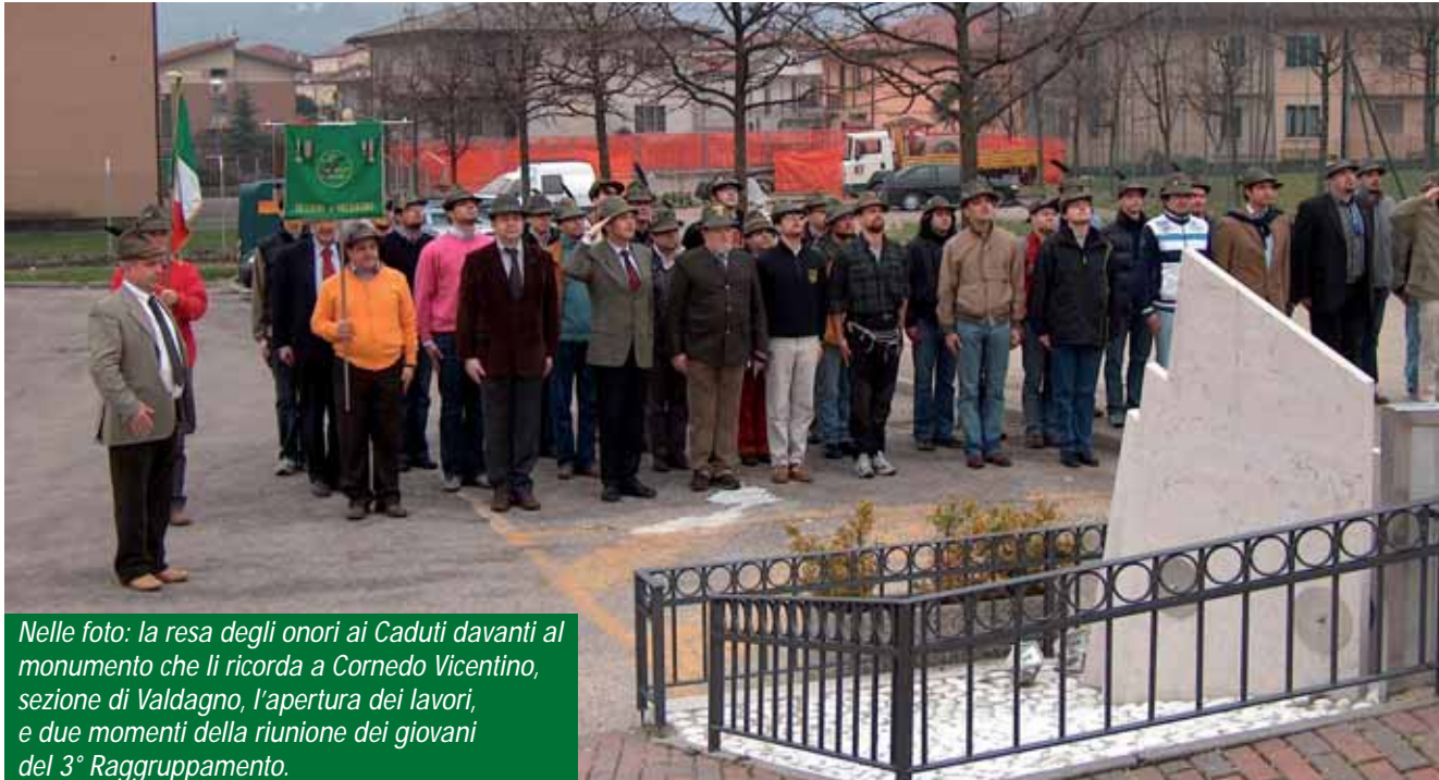
Nelle foto: la resa degli onori ai Caduti davanti al monumento che li ricorda a Cornedo Vicentino, sezione di Valdagno, l'apertura dei lavori, e due momenti della riunione dei giovani del 3° Raggruppamento.