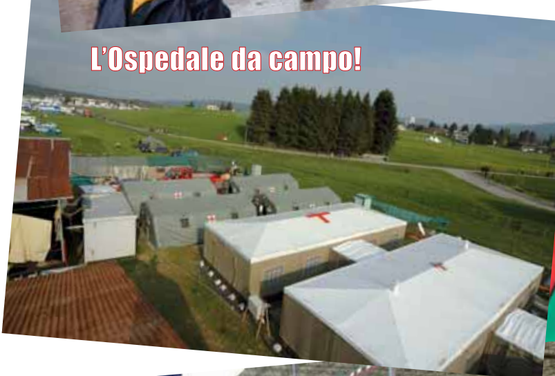
L'Ospedale da campo!