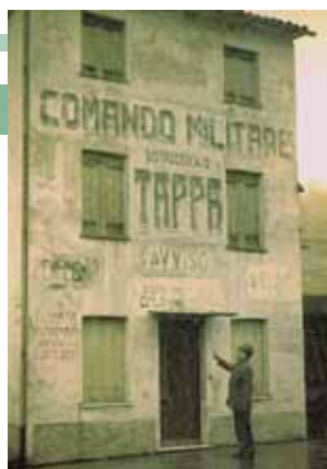
Il Comando Tappa, l'edificio è rimasto praticamente come novant'anni fa. Oggi è stato restaurato, in attesa di una destinazione d'uso.

Ma la presenza più significativa fu senza dubbio quella della leggendaria Brigata "Sassari", accantonata nel maggio 1917 a Vallonara e Marostica (151° Rgt.) e a San Michele e Bas-