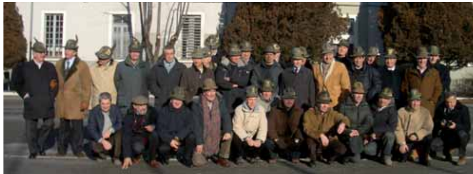
Bellissimo incontro degli AUC del 42° corso in occasione dei 40 anni dal congedo. Il giorno scelto per l'incontro, autorizzati dal comando del Centro Addestramento alpino, hanno potuto rivedere la loro caserma "Cesare Battisti" e riunirsi per una messa nella cappella del "Castello Cantore". Grande la commozione e la gioia di ritrovarsi insieme nei luoghi della giovinezza.