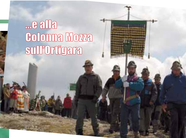
...e alla Colonna Mozza sull'Ortigara