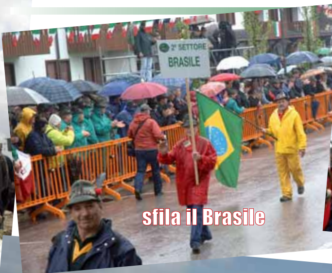
sfila il Brasile