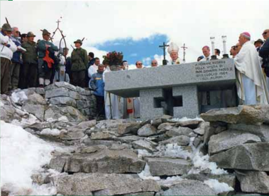
L'altare del Papa, alla Lobbia Alta, inaugurato da Giovanni Paolo II il 17 luglio 1984.

Q uesto il programma del 43° pellegrinaggio in Adamello, che si svolgerà dal 28 al 30 luglio, dedicato a due cappellani delle Giudicarie-Rendena: don Grazioso Bonenti e don Rinaldo Binelli.