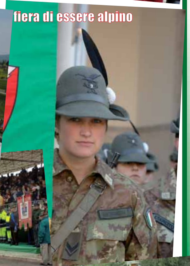
fiera di essere alpino