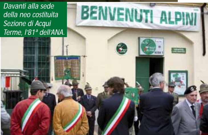
Davanti alla sede della neo costituita Sezione di Acqui Terme, l'81ª dell'ANA.