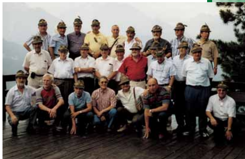
Gli allievi del 7° corso ACS alla SMALP di Aosta a 40 anni dal congedo. Il prossimo appuntamento è fissato per il 17 e 18 giugno a Bologna. Per informazioni contattare: Porriño 0141/966306 casa o 0141/961871 ufficio, Comincini 0365/520827, Plotegher 0464/834745.