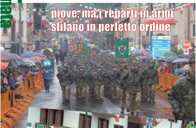
piove, ma i reparti in armi sfilano in perfetto ordine