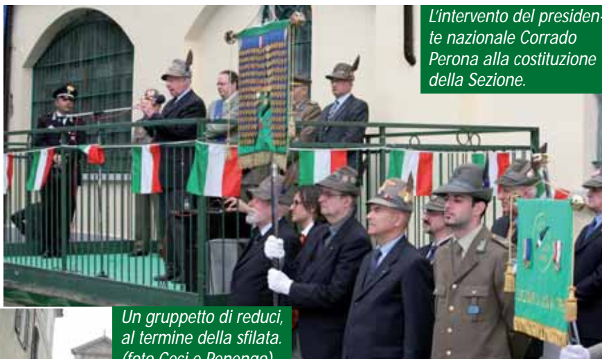
L'intervento del presidente nazionale Corrado Perona alla costituzione della Sezione.

La domenica sfilata, in questo caso particolare: l'ANA accoglieva di nuovo tra le sue braccia una figlia e il momento era solenne. Intorno al Labaro, venticinque Vessilli e tanti gagliardetti; al posto d'onore anche il Gonfalone della Provincia di Alessandria decorato di Medaglia d'Oro