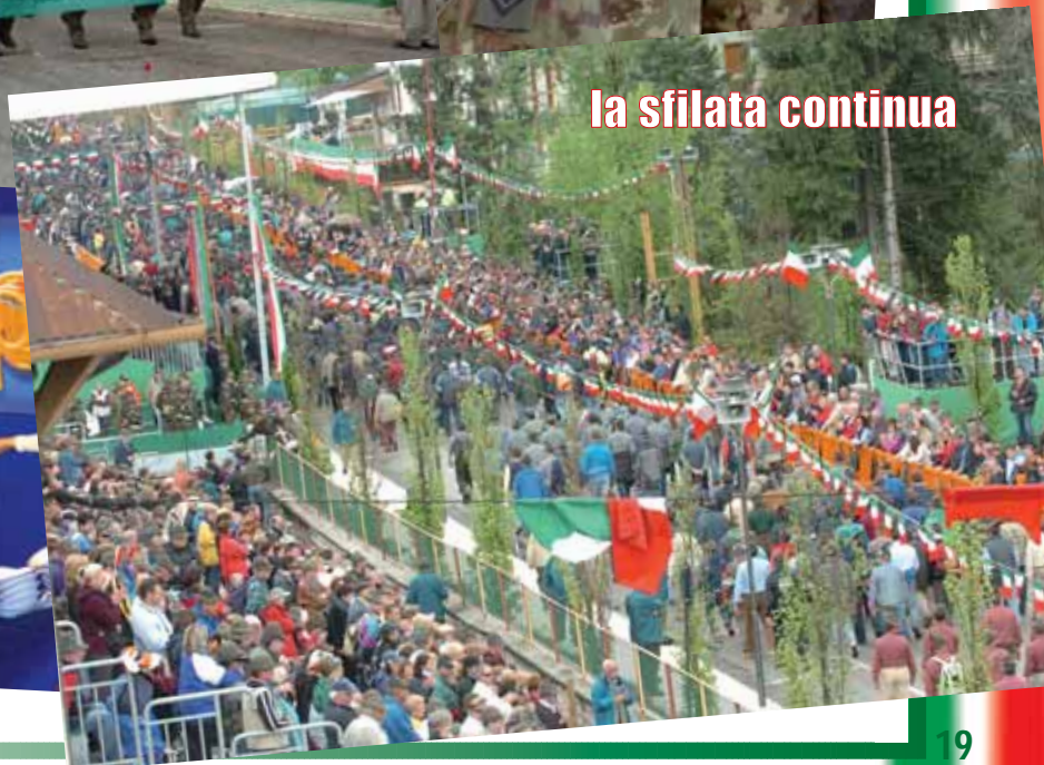
la sfilata continua