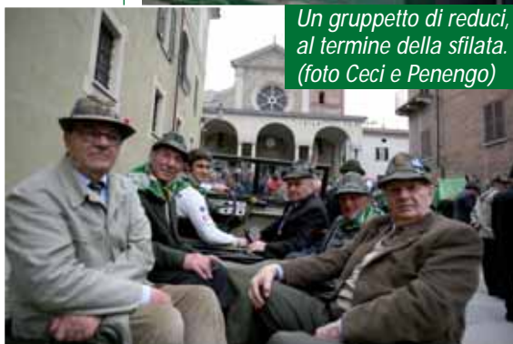
Un gruppetto di reduci, al termine della sfilata.