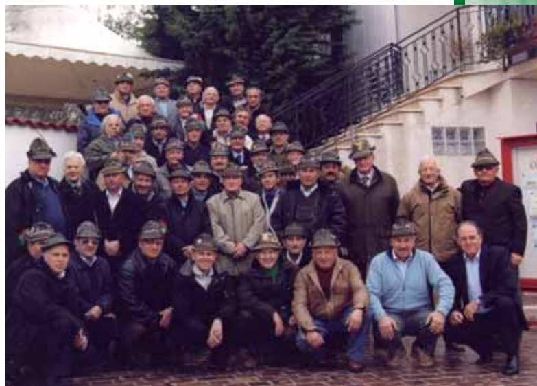
Battaglione l'Aquila, Tarvisio 1966. Ecco i veci del 1° 1966 ad Alanno, per il 40° dal congedo. Erano presenti, ospiti d'onore, i colonnelli Stopponi e Chinellato.