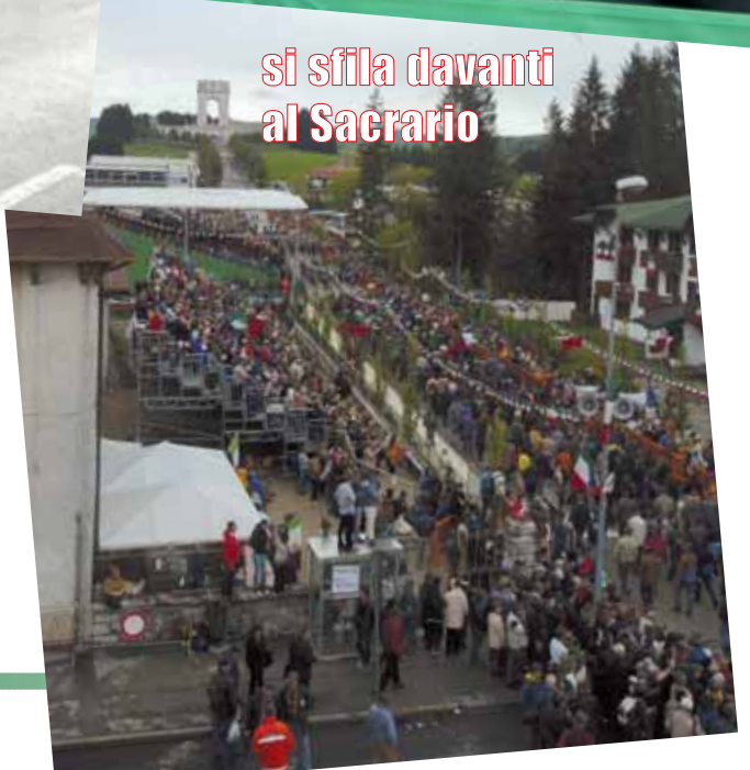
si sfila davanti al Sacrario