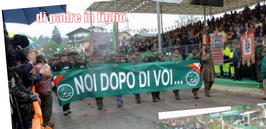
di padre in figlio